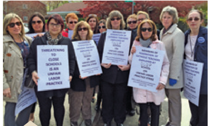
Los maestros en paro se manifiestan en la escuela primaria e intermedia Our Lady Queen of Peace de Staten Island, Nueva York.

“Realizamos estos paros para salvar muchas escuelas católicas”, continuó. “Es injusto para nuestros miembros, y para los estudiantes de las escuelas católicas, que se nos amenace con el cierre de escuelas simplemente por ejercer nuestro derecho legal de negociar colectivamente. El Papa Francisco señaló que el trabajo de los maestros de escuela está muy mal pago. Es una lástima que la Arquidiócesis no se dé cuenta de que el Papa tiene razón”.