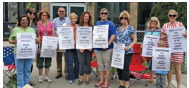
Los huelguistas permanecen unidos en la escuela primaria e intermedia Sacred Heart de Hartsdale, Nueva York.